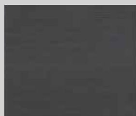
TOPLINE L1 dub grafit