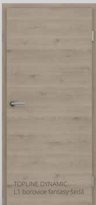
TOPLINE DYNAMIC L1 borovice fantasy šedá