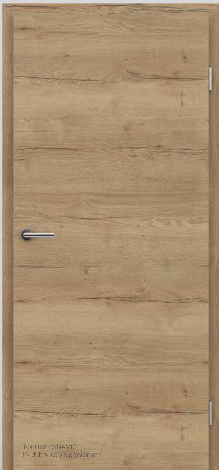
TOPLINE DYNAMIC L1 dub sukátý s prasklinami

Nová rozšířená nabídka foliovaných povrchů DYNAMIC s hrubou 3D povrchovou strukturou je skvělou a vděčnou náhradou klasických DUBOVÝCH dýhovaných dveří.