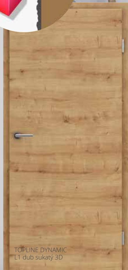
TOPLINE DYNAMIC L1 dub sukátý 3D