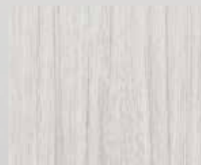
TOPLINE bílý palisandr