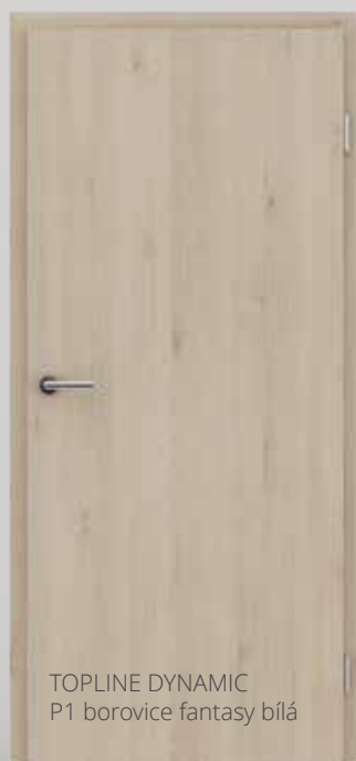
TOPLINE DYNAMIC P1 borovice fantasy bílá