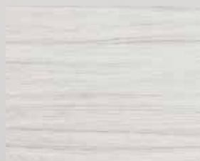
TOPLINE L1 bílý palisandr