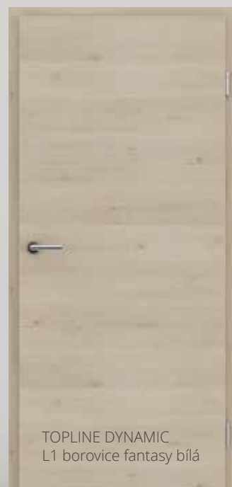
TOPLINE DYNAMIC L1 borovice fantasy bílá