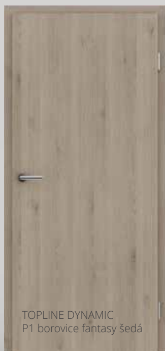
TOPLINE DYNAMIC P1 borovice fantasy šedá