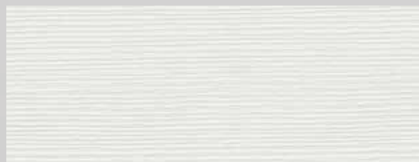
TOPLINE L1 sněhově bílá