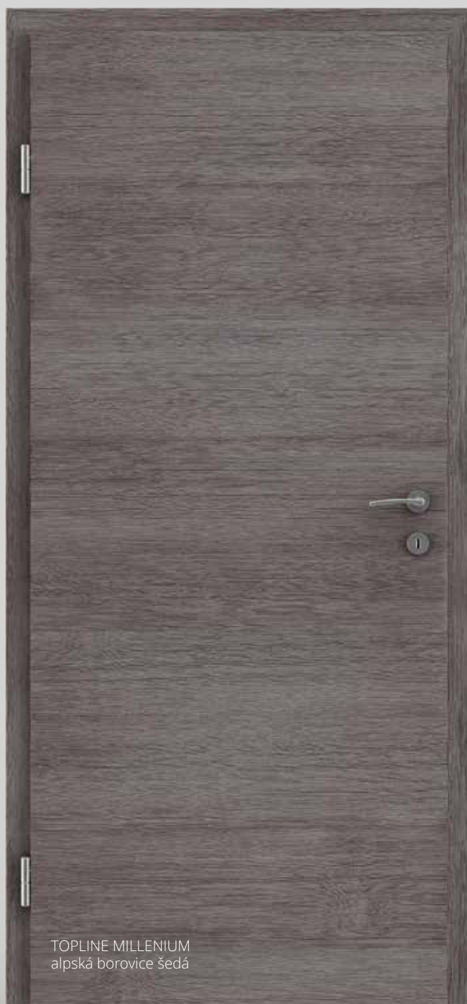
TOPLINE MILLENIUM alpská borovice šedá