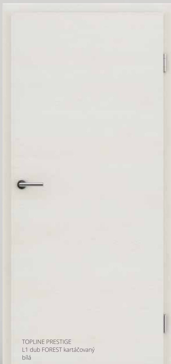
TOPLINE PRESTIGE L1 dub FOREST kartáčovaný bílá

Povrch se synchronizovanými póry pro vzhled skutečného MASIVNÍHO dřeva.