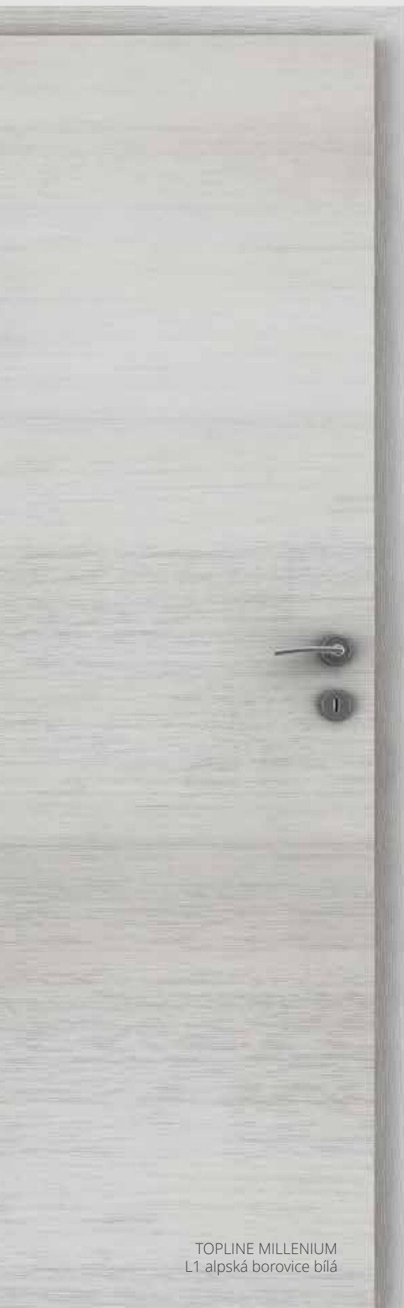
TOPLINE MILLENIUM L1 alpská borovice bílá

Povrch, který nadchne dokonalou strukturou vzhledu dýhy FINE-LINE.