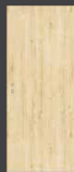
model P1 svíslá struktura