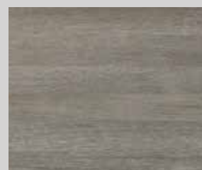
TOPLINE L1 dub šedý