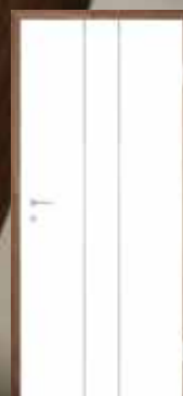
T45 5 mm