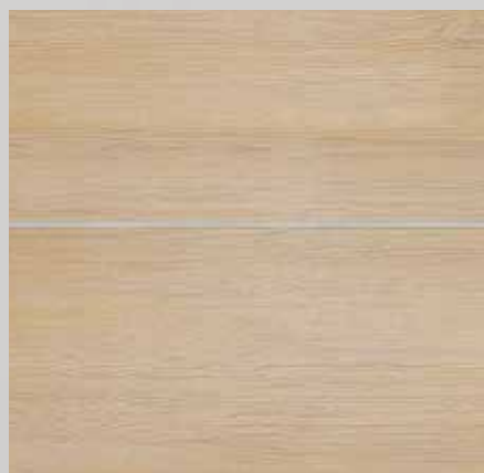
TOPLINE / L1 MILLENIUM alpská borovice běžová T40