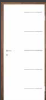
T17 intarzie z NEREZOVÉ OCELI