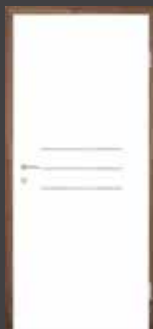
T4 intarzie z NEREZOVÉ OCELI