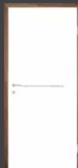
T16 intarzie z NEREZOVÉ OCELI