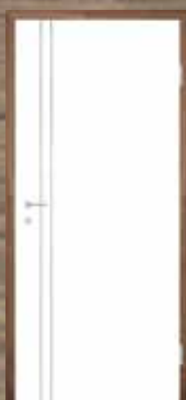
T37 5 mm