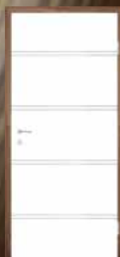
T43 5 mm