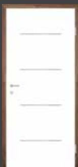
T2 intarzie z NEREZOVÉ OCELI